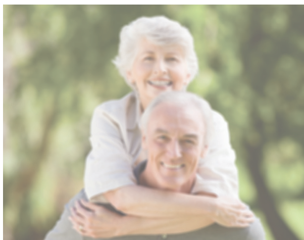
VISÃO COM CATARATA